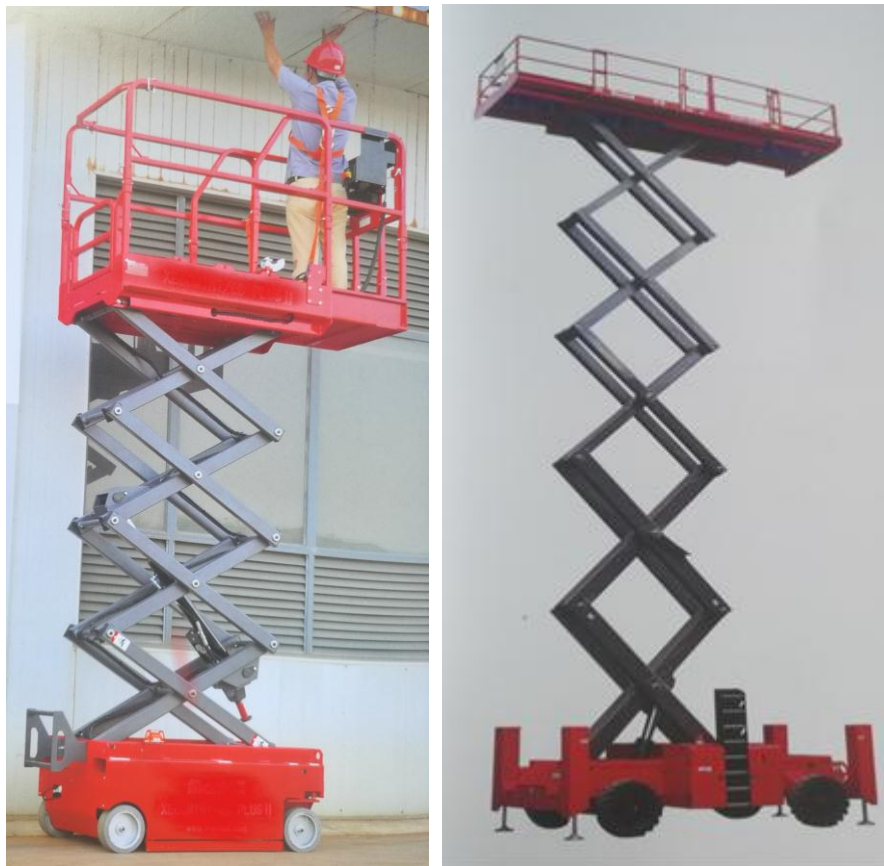
图 1 剪叉式高空作业车实物示例

本文涉及的产品是一款自研的（非合同条件下立项的）、刚完成设计和开发、拟推向市场公开销售的某型自行电动剪叉式高空作业平台（以下简称高空作业车），产品是将人及工具顶升到高空开展作业的装备，实物示例。见图 1。