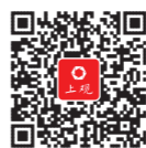
扫二维码 看面试“艺人”

高导再次强调资料一定要拍,“今天你就签合同,直接到棚里拍摄,拍完就有模特卡、相册、光盘、视频。至于费用,现场能付多少付多少,之后从报酬里扣。”