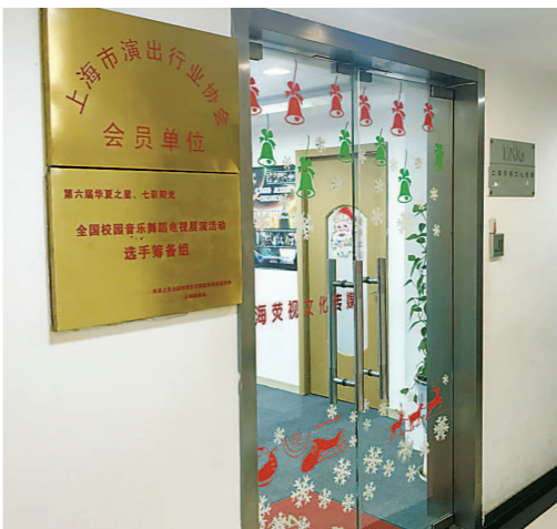
门口挂着“上海市演出行业协会会员单位”标牌。