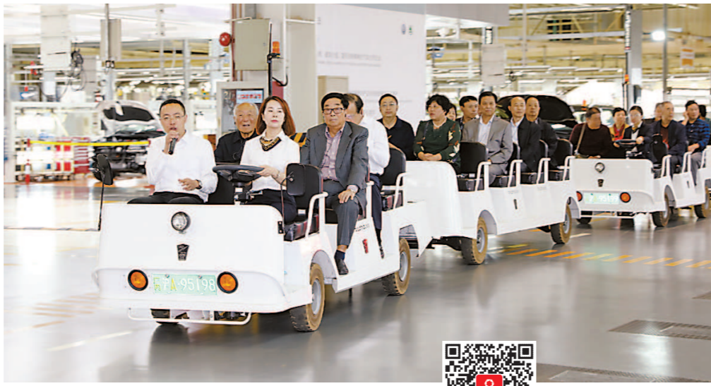
上汽大众工厂车间内,游客乘坐电瓶车参观。(资料)