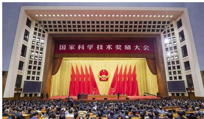
国家科学技术奖励大会召开

李克强指出，首先应加快完善激励和保护创新的制度体系，加快改革科技成果产权制度、收益分配制度和转化