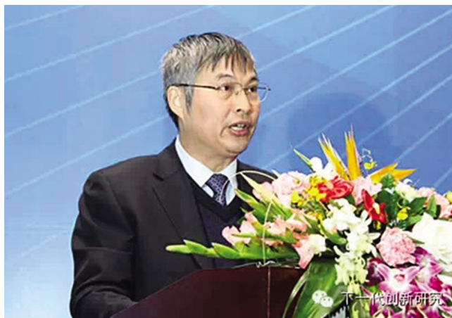
京东方科技集团董事长王东升发表主题演讲

的,坚持了 20 年,教授去世了,学生继续坚持下去,前 39 年都在赔钱,现在赚大钱了。我到那家公司看了他们的介绍,心里真是很感动,自问自己,我们能有这种执着吗?