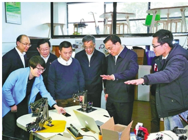
李克强体验“创客”创意产品

现。Fab Lab(微观装配实验室)及其触发的以创客为代表的创新 2.0 模式,基于从个人通讯到个人计算,再到个人制造的社会技术发展脉络,试图构建以用户为中心的,面向应用的融合从创意、设计到制造的用户创新环境。深圳的创客群体绝大多数为年轻人,来自于 IT 行业,作为热衷于创意、设计、制造的个人设计制造群体,开源硬件支撑起他们各显身手的舞台。而深圳所在的珠三角在全球无与伦比的硬件配套能力,使其成为国内创客产业链最完整的城市,吸引了国内外“玩家们”来此创业。柴火空间创始人寓意“众人拾柴火焰高”,成立 4 年已经吸引 1 万多人参加活动。空间创始人希望总理能成为柴火创客的荣誉会员,李克强欣然应答:“好,我再为你们添把柴!”