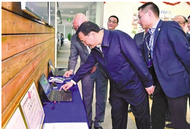
李克强见证首家互联网银行的第一笔贷款

是政府刺激经济的法宝，如何投资创业与创新企业，也是创新 2.0 时代中国经济新常态需要研究的课题。大量涌现的创业公司，对小微企业的融资提出了很高的要求，除了活跃的天使与风险资本之外，还需要为小微企业的贷款服务，因为单位贷款额的服务成本很高，通过互联网的方式是一种有效解决成本问题的途径。