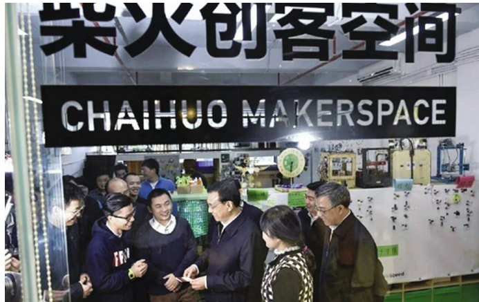
李克强考察柴火创客空间