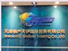
天津物产天伊国际贸易有限公司 Tewee-ITC Global Trading Co., Ltd

同时灵活运用伊藤忠商事的海外网络以及具有竞争力的资金筹措能力，在中国积极开展投资项目。与天津物产集团有限公司合资成立铁矿石、制铁原料销售公司(天津市)，构筑国内销售网及价值链。