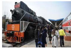
绿皮火车变身大学食堂