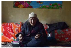
慰安妇：最大夙愿是 进共产党