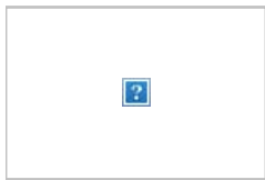
重庆黔江：小学生课 间习武健身