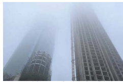
浓雾笼罩 高楼如楼团