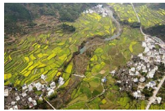
婺源油菜花海美如画