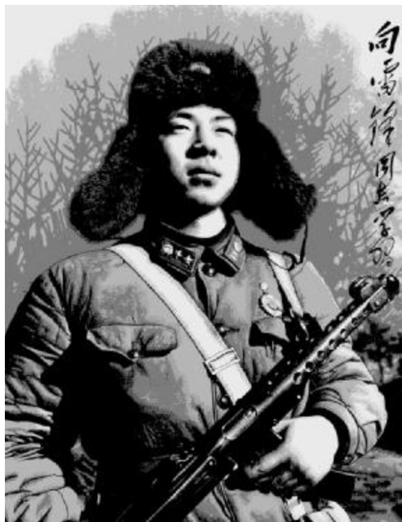
▲新写实多层剪纸:雷锋

于自己的剪纸艺术之中。又以民间流传的两百多出戏曲中的600多个人物为模特,抓住人物思想和性格的动态,进行创作。他刻制的人物,形神兼备,性格鲜明。王老赏的剪纸艺术在构图、刻制、点彩三方面都有创新,逐渐形成了蔚县剪纸艺术风格。王老赏从事剪纸技艺40余年,被艺术界誉为农民剪纸艺术家,被后学者奉为一代宗师。 蔚县剪纸艺术特色独具一格,构图饱满充实,场面铺置得满满当当,实多于虚,黑大于白,面强于线;造型生气活泼,在写实基础上,进行夸张和变形。渲染形象的生气,捕捉形象的形态,注重形象的神似;色彩浓艳亮丽。红要红到底,绿要绿到家。在色彩的对比上强调调暖。以色彩的明度和纯度提升响亮的色彩调子。蔚县剪纸表现内容丰富。花鸟虫鱼剪纸是蔚县剪纸作品中份量最大的部