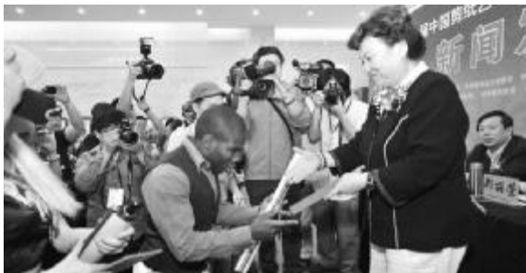
▲中国文联副主席、著名评书表演艺术家刘兰芳代表蔚县和文联向学员颁发收徒证书