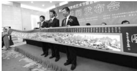
▲蔚县领导向北京对外经贸大学赠送《蔚县清明上河图》作品