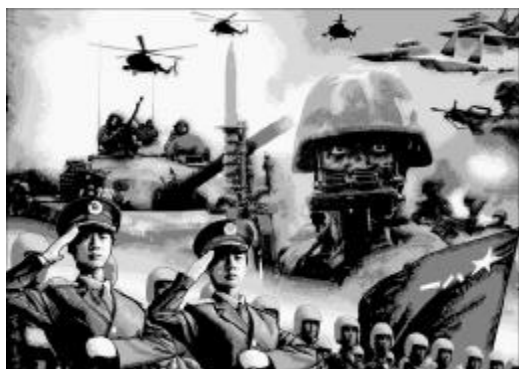
▲新写实多层剪纸:军威