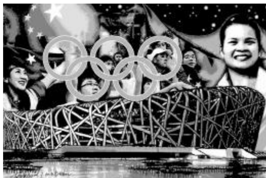
▲新写实多层剪纸:百年奥运