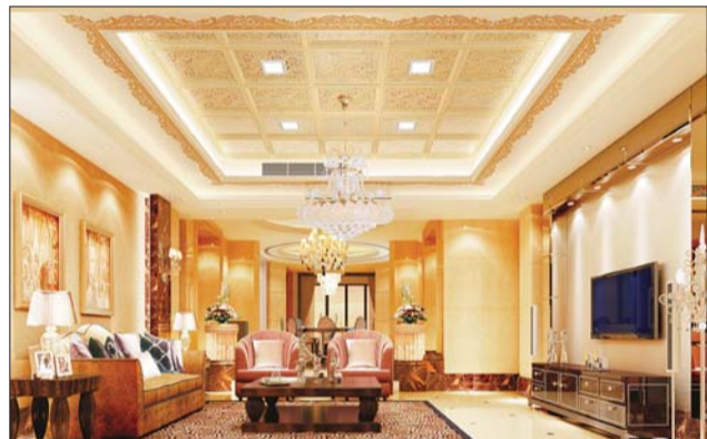
客厅吊顶装修效果图