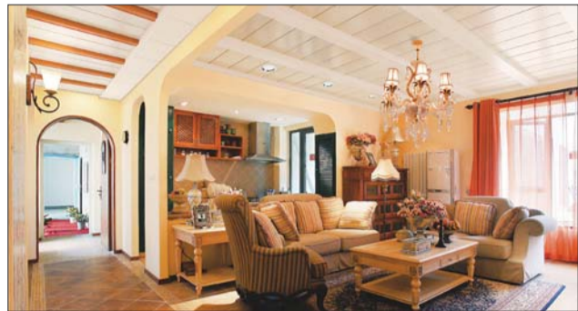
客厅吊顶装修效果图