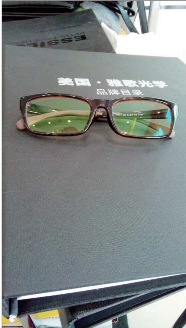
这副防蓝光眼镜的镜片稍呈橙黄色。

对于一些价格低、无品牌的眼镜,张文提醒在选购的时候要谨慎,有的防蓝光镜片不仅不护眼,而且会对眼睛造成伤害。“在网上购买风险比较大,有的镜片会改变可视的光线,对眼睛造成伤害。”