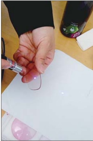
眼镜店店员做的激光笔测试,防蓝光眼镜经过照射,在白纸上蓝点小且柔和。

当记者问防蓝光眼镜的效果到底如何时,多家店员一致称,对电脑、手机、LED灯等人工光源所发出的蓝光有非常好的阻隔作用,可以有效缓解眼睛干涩、疲劳等症状,基本上对眼睛没有伤害,而平镜防蓝光眼镜可以很多人共同使用。