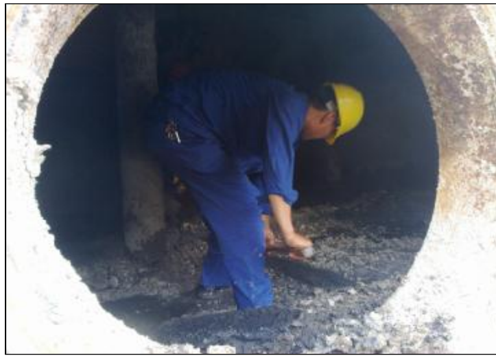
近日,水电分厂成功对工业废水处理罐斜板进行拆除。由于长时间运行,数千片塑料斜板与碱疤牢牢板结到一起,布满槽罐,厚达1米,清理十分困难。排水车间员工冒酷暑,立体作业,轮番上阵,用钢钎凿、铁锹铲,脚踏手板,上下传递,迎难而上,顺利完成79方斜板拆除量,确保了工业废水合格回用。图为检修人员正在进行清理。