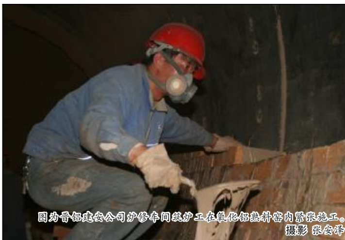
图为晋铝建安公司炉修车间炉工在氧化铝窑料窑内紧张施工。

带着设备采购的任务,王立中来到有着中国耐磨铸件之都之称的安徽宁国,考察全自动油淬热处理流水线。“买设备不难,主要是来验证关于产品性能的前期设想。”有