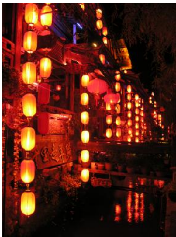
江南夜景