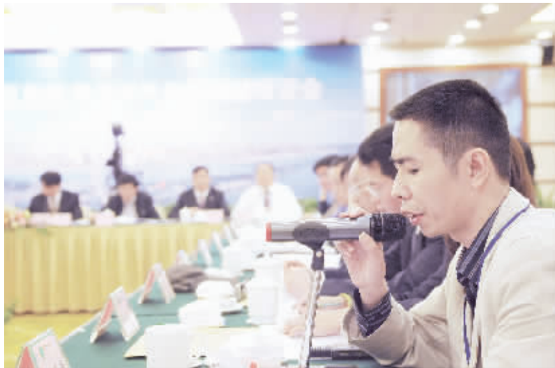
10月25日,长沙神农大酒店会议厅,长沙市城区民用天然气价格调整听证会上,居民代表正在发言。

10月25日上午,长沙市物价局举行了民用天然气价格调整听证会,针对两种方案,20名听证代表中16名选择了“比较实惠”的方案二,3名代表选择了“比较科学合理”的方案一,另有1名代表不同意这两套方案。