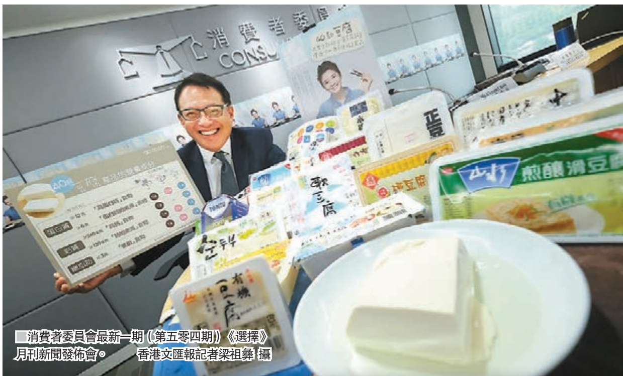
消費者委員會最新一期《第五零四期》《選擇》月刊新聞發佈會。

投訴人付款安裝後，在網上看到不少關於上門推銷濾水器的報道，懷疑受騙，要求該公司收回濾水器退款，經消委會介入後成功獲退回1,400元。