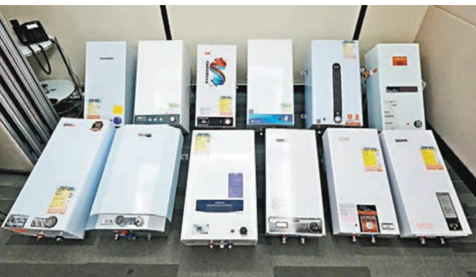
電熱水爐質素參差，且其中6款樣本效能低於能源效益標籤。