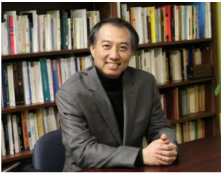
国内主席 Domestic Chair