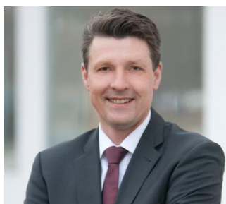
国际主席 International Chair