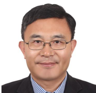
国内主席 Domestic Chair