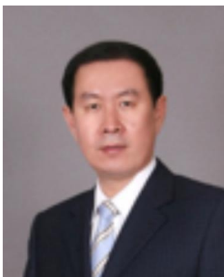
国内主席 Domestic Chair