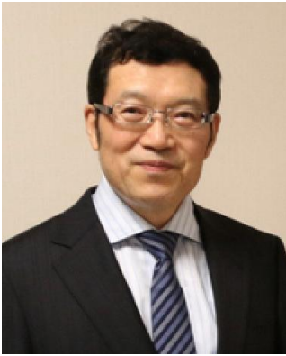
国际主席 International Chair