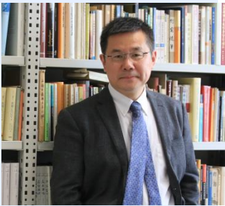
国内主席 Domestic Chair