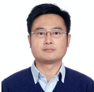
国内主席 Domestic Chair