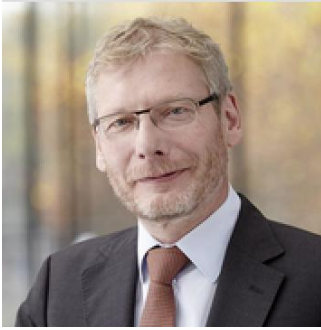
国际主席 International Chair