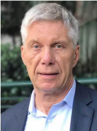
国际主席 International Chair