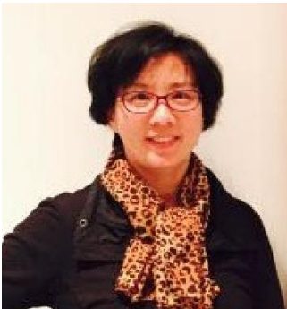
国内主席 Domestic Chair