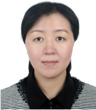
国内主席 Domestic Chair