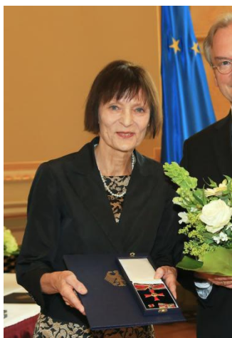
国际主席 International Chair