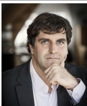
国际主席 International Chair