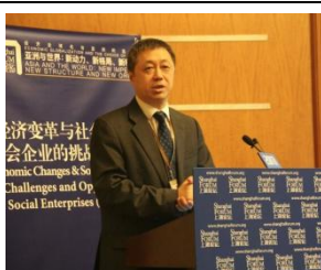
国内主席 Domestic Chair