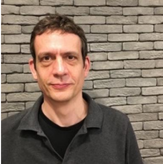
国际主席 International Chair