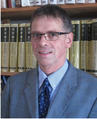
国际主席 International Chair