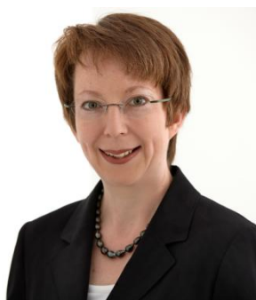
国际主席 International Chair