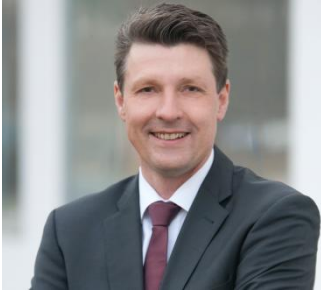
国际主席 International Chair