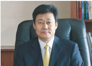
国内主席 Domestic Chair