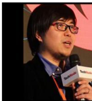
国内主席 Domestic Chair