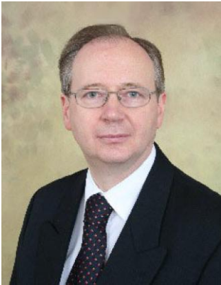
国际主席 International Chair