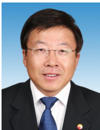
国内主席 Domestic Chair