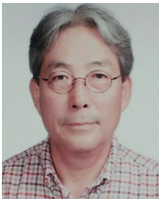
国际主席 International Chair