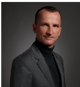
国际主席 International Chair