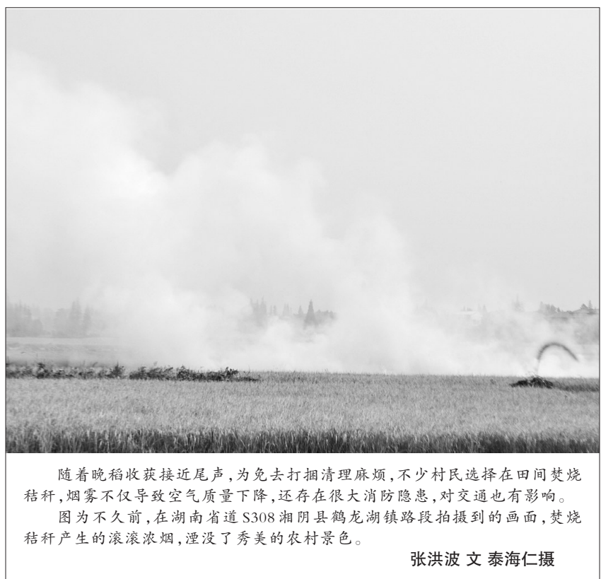
随着晚稻收获接近尾声,为免去打捆清理麻烦,不少村民选择在田间焚烧秸秆,烟霾不仅导致空气质量下降,还存在很大消防隐患,对交通也有影响。图为不久前,在湖南省道S308湘阴县鹤龙湖镇路段拍摄到的画面,焚烧秸秆产生的滚滚浓烟,淹没了秀美的农村景色。

完善行政处罚报告和备案制度,开展环境行政处罚、行政复议案件和法律文书分析、检查活动。健全执法审查制