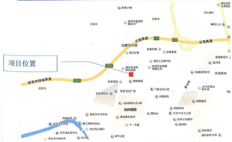
附图 1 地理位置图