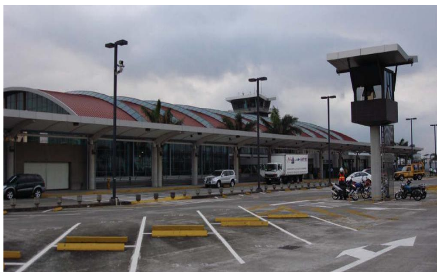
胡安·圣塔马利亚国际机场