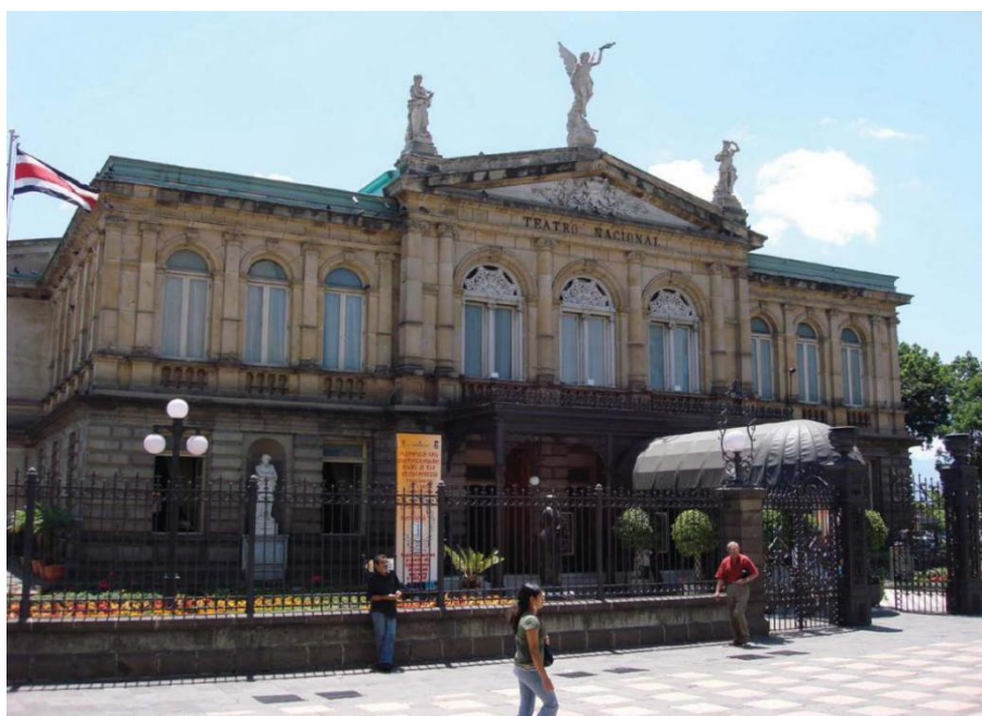
哥斯达黎加国家剧院

【广播】当地最具影响力的广播电台是monumental和columbia两家综合性电台。