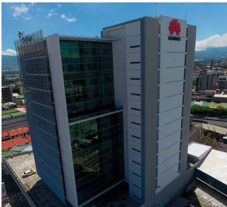
华为哥斯达黎加公司