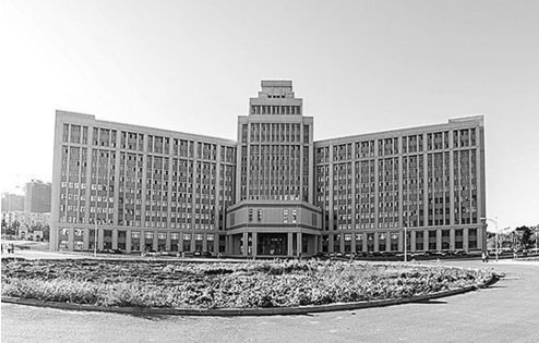
2015年投入使用的成栋楼