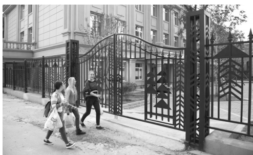
新建成的留学生公寓

进一步美化校园环境，建设美丽东林，展现大学气象，让每一个东林人生活得更幸福、更和谐、更有归属感和尊严感，这是学校党委的庄严承诺和坚定不移的工作理念。而学生宿舍紧张、校园环境与林业大学身份不匹配等问题已经困扰学校多年。承诺就要兑现，认准的路再难也要走下去。近年来，随着校园南区、北区诸多建设工程的竣工，昔日的“废墟”“荒地”已经变成了东林新的景致。为师生营造良好校园环境的决心，正在脚踏实地的努力中渐渐变成现实。