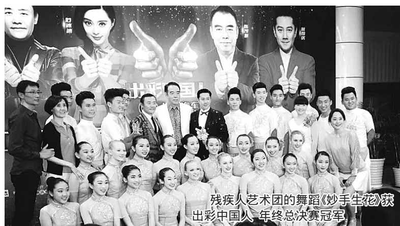
残疾人艺术团的舞蹈《妙手生花》荣获出彩中国人·年终总决赛冠军

经过30年的办学积累，郑州师范学院特殊教育学院已经成为支撑河南省特殊教育事业发展的中坚力量。学院目前设置有6个本科专业方向。现有在校生930人，专业课教师33人。已逐渐形成了“特殊教育师范专业与听障残疾人高等教育专业相结合的”办学思路。回顾三十年的发展历程，我们欣慰地感受到，它撑起了河南特殊教育发展的一片蓝天。