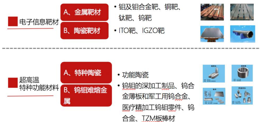
图1 靶材及超高温特种功能材料业务布局