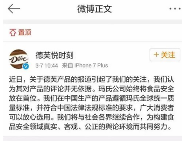
▲德芙官方微博回应截图

第三方检测机构称其矿物油含量“超大幅偏高”，而德芙却回应称，“在中国生产的产品遵循玛氏全球统一质量标准，并符合中国法律法规标准的要求。”这到底是怎么回事？