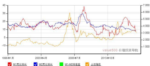
M1-M2 增速差与上证综合指数走势图

4. 原纸涨价 | 5月份成品纸市场掀起涨价潮，包括白板纸、瓦楞纸、箱板纸等纸种价格全面上调。据悉，从5月1号到5月4号短短4天的时间，全国已经有32家纸厂宣布涨价。各纸种涨价幅度在每吨100元到300元不等。目前，主流高克重瓦楞纸全国均价在每吨4350元左右，相比年初上涨11%以上。成品纸价格上涨还有一个主要因素是废纸价格上扬。短期来看，纸品旺季到来，加上外废政策的持续收紧，成品纸价格易涨难跌。