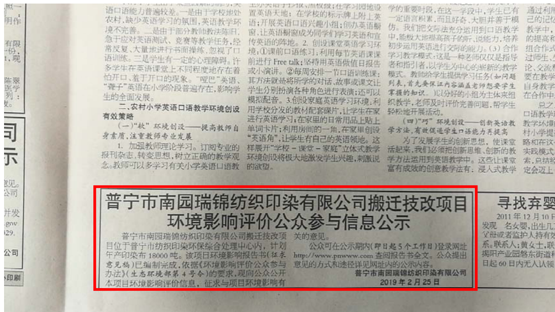
图 2.2-4 征求意见稿 2 月 26 日报纸公示照片 (c)