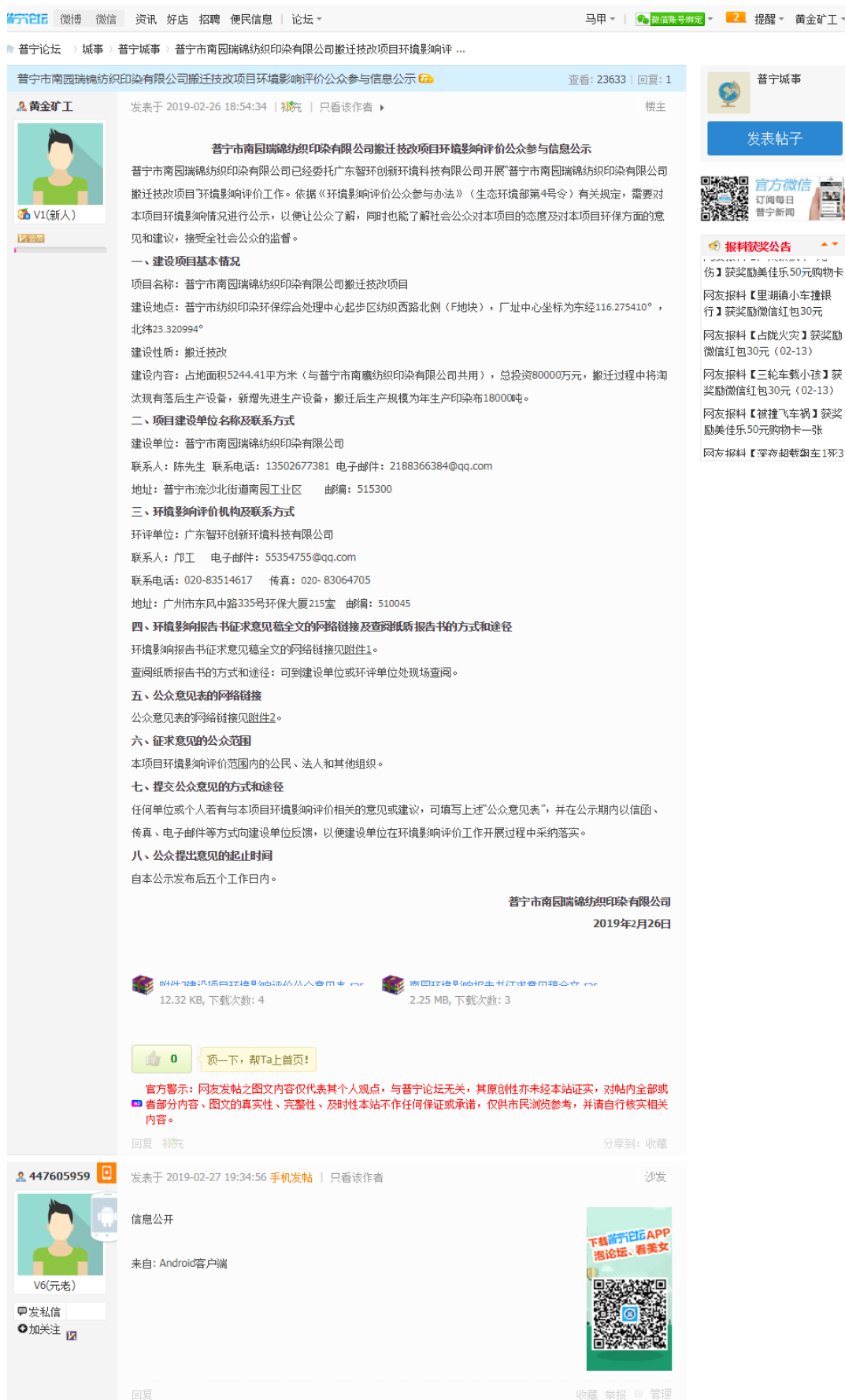
图 2.2-1 征求意见稿网络公示截图