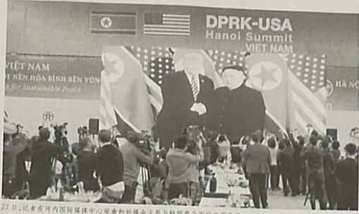
27日，记者在河内国际新闻中心观看朝美领导人金正恩与特朗普会面的电视直播。

新华社河内2月27日电 以20次交锋掀起的朝美两国领导人的非正式会晤，在河内再次拉开序幕。时隔8个多月后，再次在聚光灯下握手、微笑、寒暄。 金正恩和特朗普27日在越南首都河内再次握手、微笑、寒暄。这是朝美两国领导人自2017年6月特朗普宣布对朝鲜实施全面经济制裁以来，首次面对面会晤。金正恩和特朗普在河内进行了为期两天的非正式会晤，这是朝美两国领导人自2017年6月特朗普宣布对朝鲜实施全面经济制裁以来，首次面对面会晤。