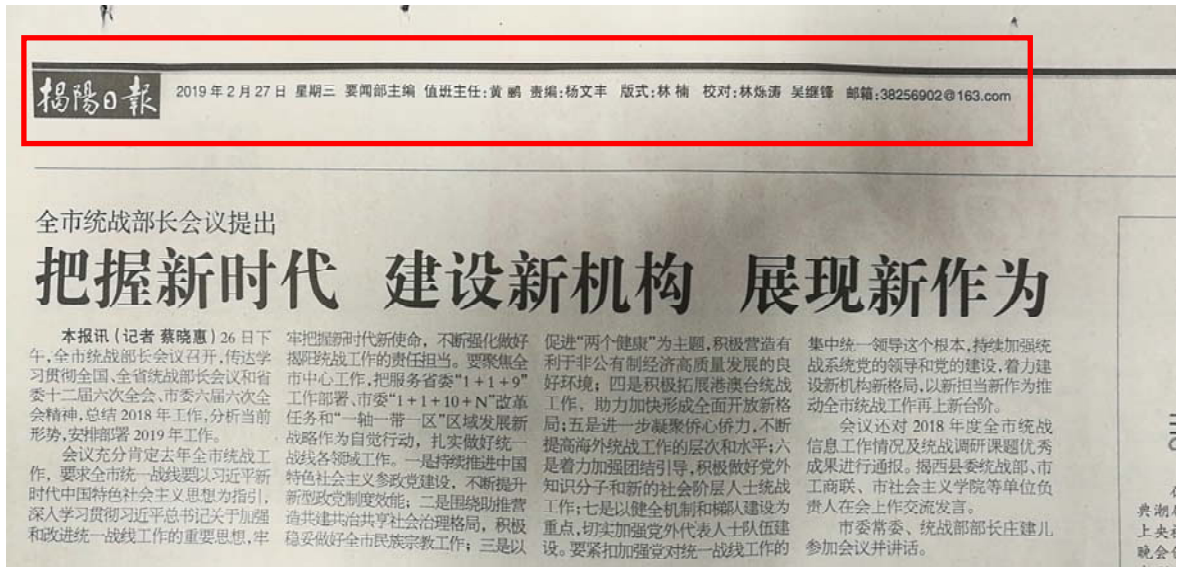
图 2.2-6 征求意见稿 2 月 27 日报纸公示照片 (b)