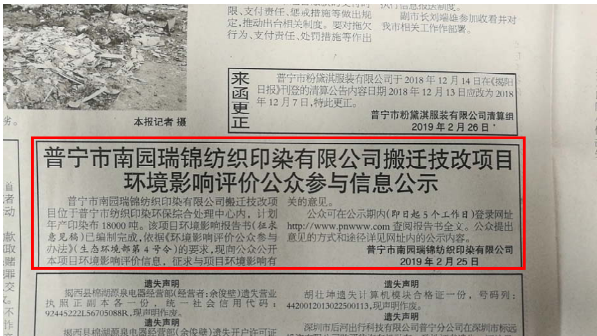
图 2.2-7 征求意见稿 2 月 27 日报纸公示照片 (c)