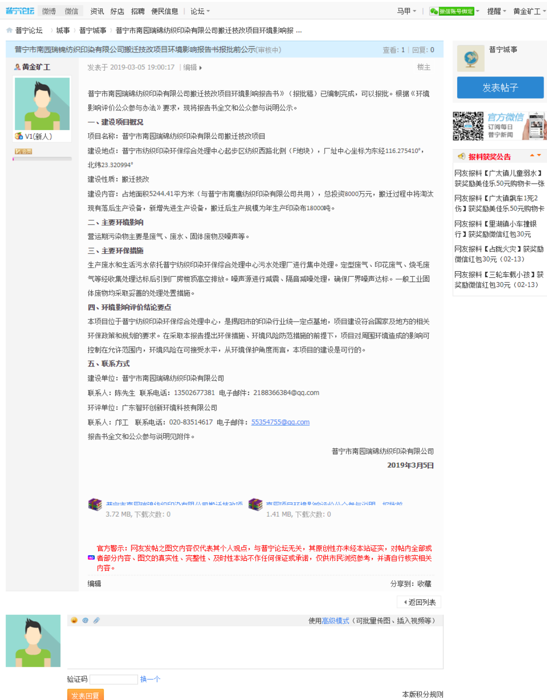
图 6.2-1 报批前网上公开截图