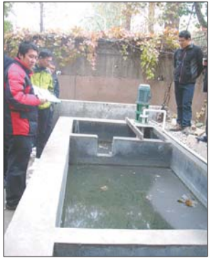
这个碱液池从未使用。

“不脱硫的话,二氧化硫肯定超标,有的单位虽进行了环保设备的建设和改造,但为节省成本并不启用,或等环保部门检查时才启动。”刘炳国告诉记者。除了这些问题,锅炉房前面的煤堆也没覆盖,一阵风吹过,带起一片煤尘。“这家单位虽然排放量不大,但出现的问题不少,我们将对其下达整改通知。”刘炳国说。