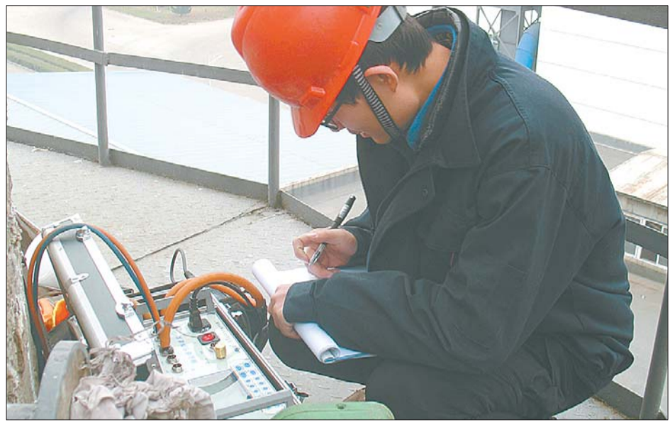
检测人员正在记录检测数据。