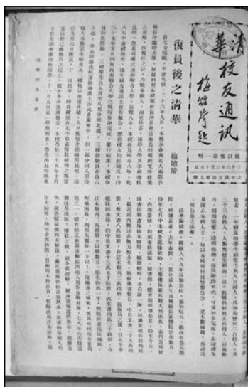
《清华校友通讯》复员后第一期版面（1947年3月15日）

运动场敌人用作大厨房，地板全部拆毁，目前因木料甚贵，暂时改用洋灰地面，勉强应用。游泳池尚未大坏，更衣室衣柜，则散失甚多。以今日学生人数之多，内部各种设备之添置，实为一大需要，在时间上、在经费上只可分期办理耳。