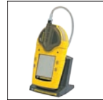
连体泵和电池充电器