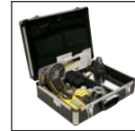
受限空间工具套装