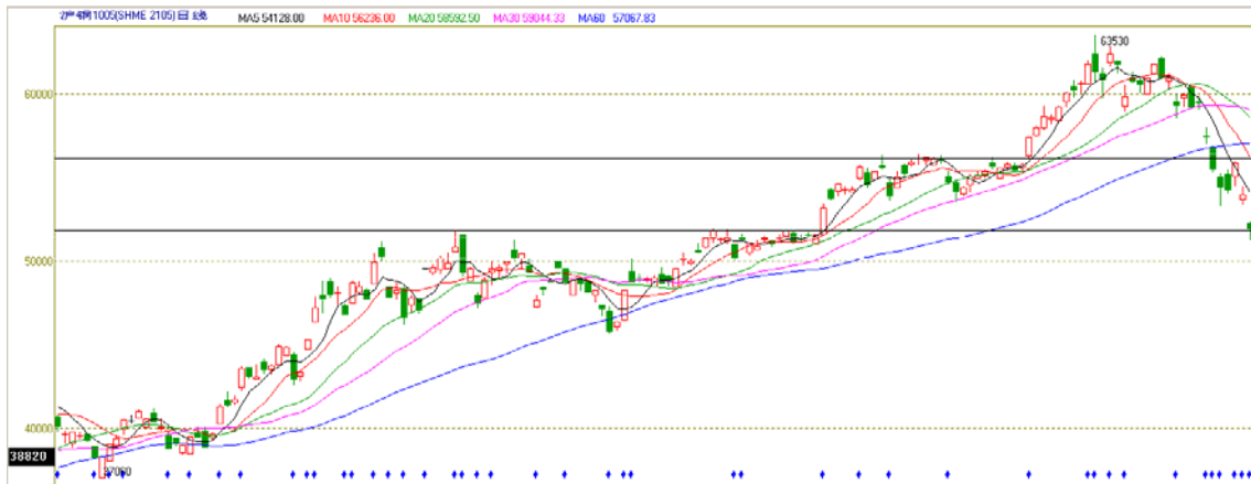
图2 上期所锌主力合约 1005 日线图