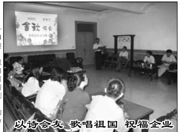
以诗会友 歌唱祖国 祝福企业