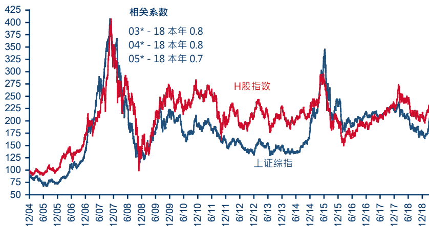
H 股指数与上证综指相对表现 (%)