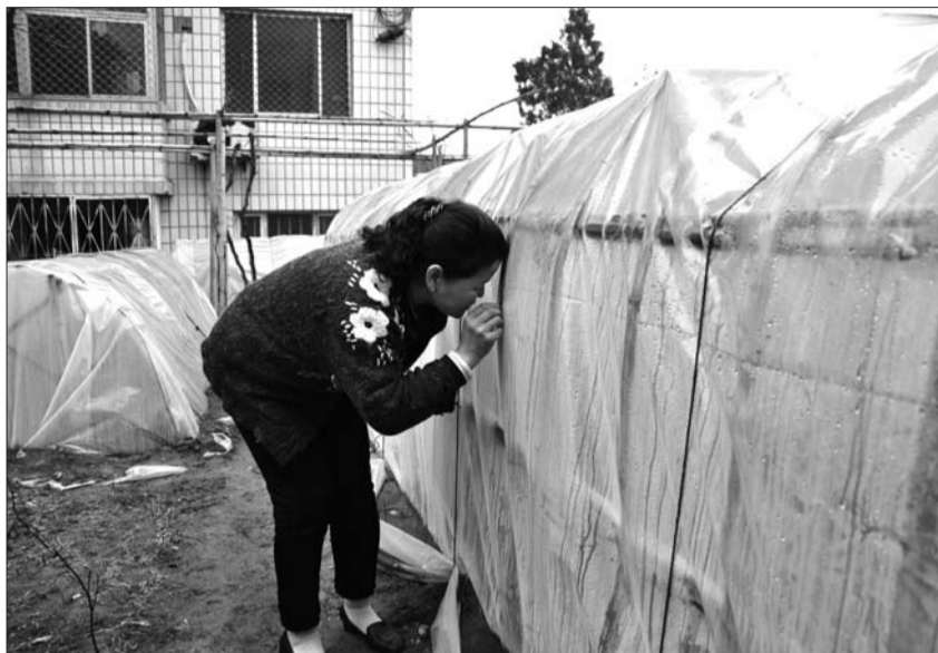
大棚里的3000多株月季长势很好。

去年,汤先生曾种了800多株花苗,由于缺乏经验,大多数没有成活。“如果今年花苗的成活率较高,我会给附近的邻居送一些。”