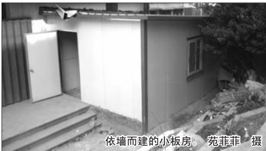
依墙而建的小板房。

本报3月20日讯(记者苑菲菲) 青年路嘉德商务大厦南边原本有条可以通行的过道,但这里先是被建了堵墙封起来,接着又有人依墙搭了个移动板房。20日记者看到,这个移动板房建在一条宽约5米左右的小路上,里面放了些用剩的建筑材料。