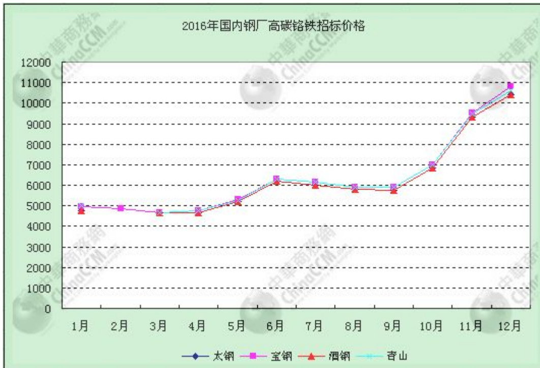
图 2 2016 年国内钢厂招标高碳铬铁价格走势