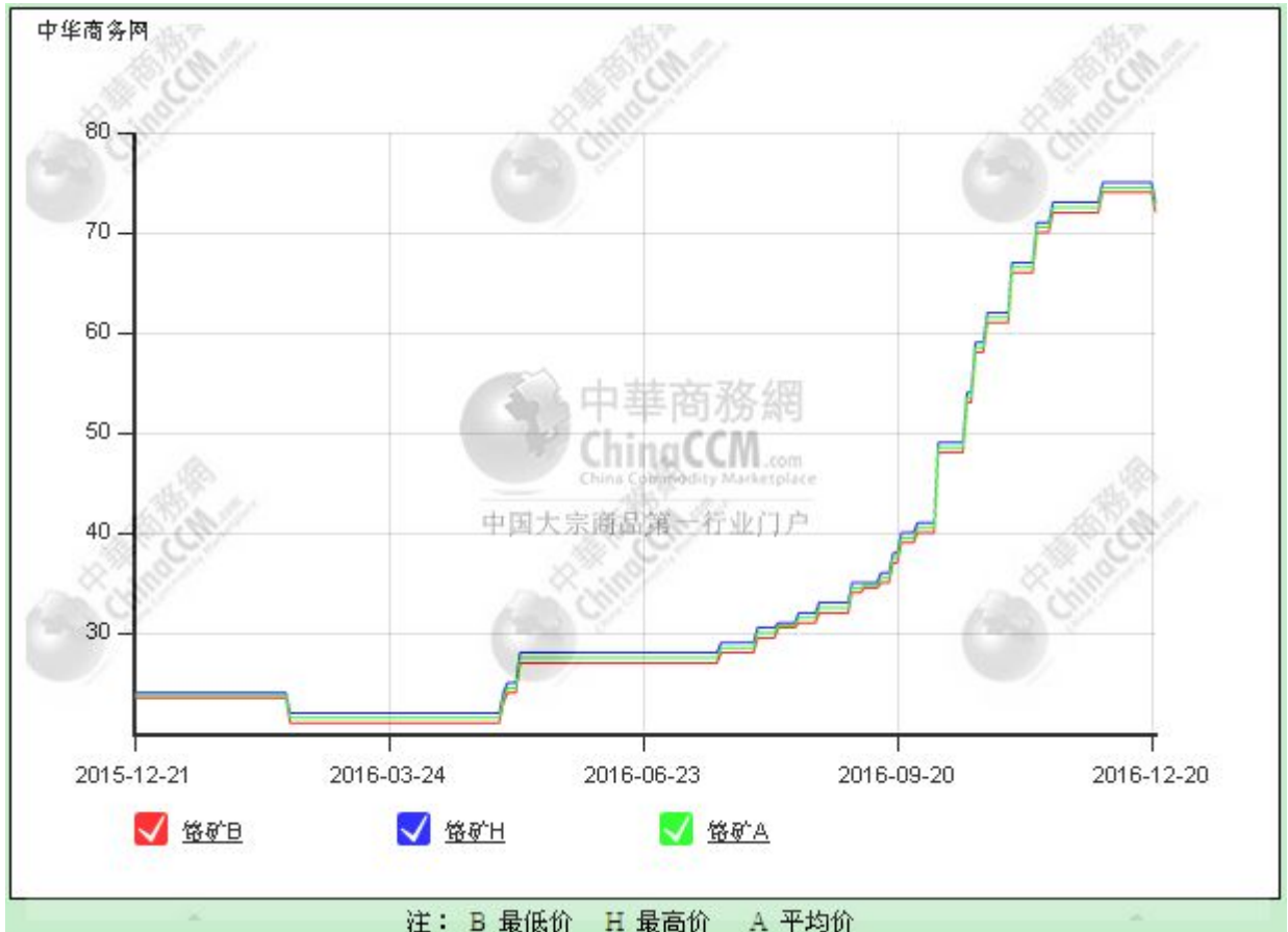
图 4 中国港口南非铬矿 Cr2O3 42%价格走势图 单位：元/吨度