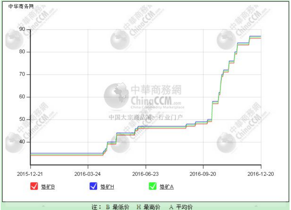
图3 中国港口土耳其铬矿 Cr2O3 42%价格走势图 单位：元/吨度