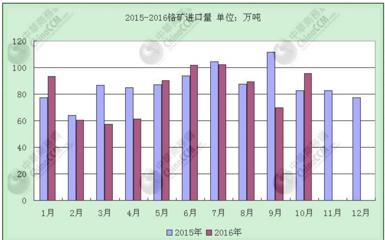
图 5 2015-2016 年我国铬矿进口量对比

数据显示,2016 年 1-10 月铬矿进口总量为 821.65 万吨,较 2015 年 1-10 月份的 880.29 万吨,同比下降 6.66%。