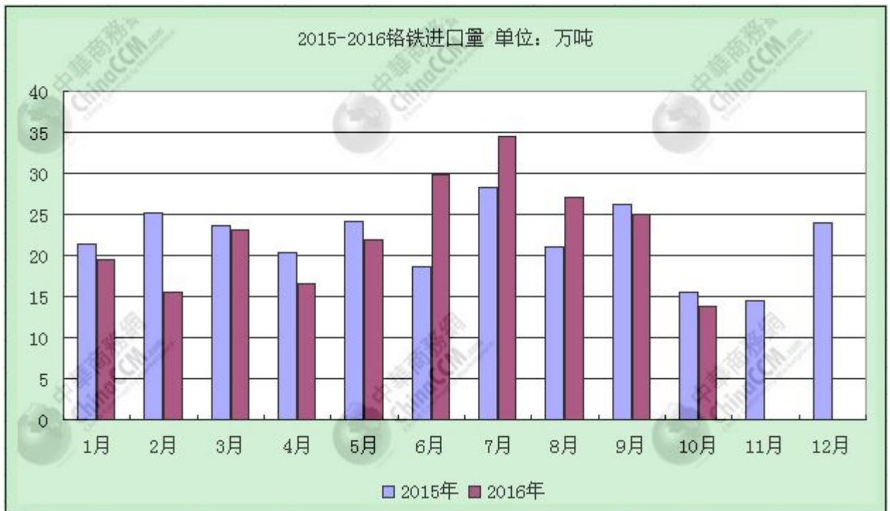
图 6 2015-2016 年我国铬铁进口量对比

数据显示，2016 年 1-10 月铬铁累计进口量为 226.42 万吨，较去年同期的 224.3 万吨，微增 0.95%。