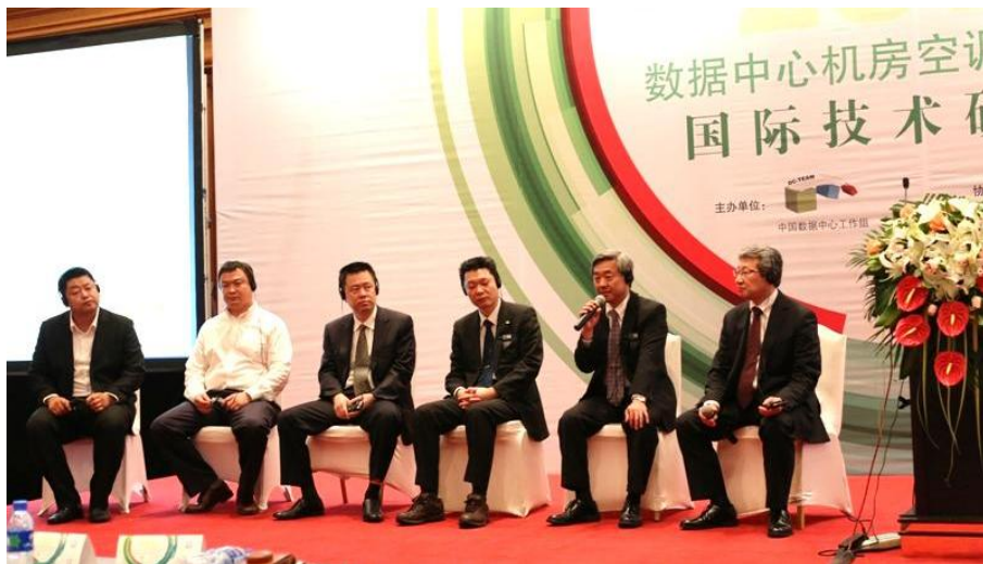
研讨会现场互动环节

会议厅外，日立所带来的先进产品、尤其是吊顶式高效节能空调系统吸引了与会人员纷纷驻足参观，询问相关的技术细节。