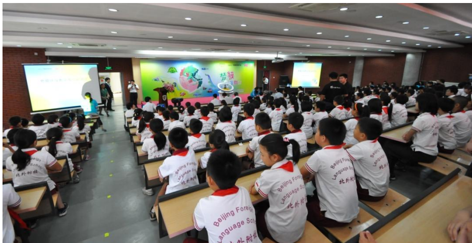
“梦獭环保教室”活动现场

“梦獭环保教室”活动旨在通过日立志愿者向小学生普及环保知识，提高学生的环保意识，培养“环保行动，从我做起”的思想。为了能引起孩子们的兴趣，日立结合自身在中国的环保形象大使“梦獭”，制作了精美的环保画册《会唱歌的地球》，通过志愿者亲身演绎画册中的童话故事，使课堂变得生动有趣。本活动从今年开始正式启动，将率先在北京、上海、广州、大连、香港等地共10所小学展开。今后日立集团还将不断扩大活动规模，将其打造成日立在中国的标志性公益活动。