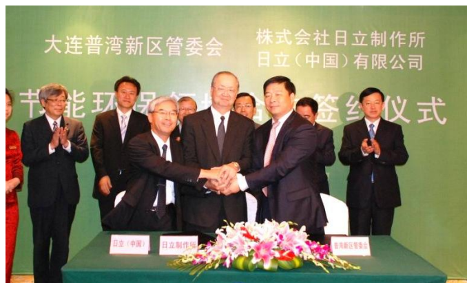
日立与大连市普湾新区签订节能环保领域的合作框架协议

日立与大连自2010年10月就资源循环和低碳经济领域合作达成共识后，不断取得积极进展，并进一步于展会前日的7月10日，与大连市普湾新区签订了节能环保领域的合作框架协议。根据协议，日立将与大连普湾新区在此合作示范项目的带动和市场推动下，在公共设施和生产型企业的节能环保技术、以及能源的高效供给和使用等领域开展合作。今后，双方将共同实施调查、试点实验、事业计划等工作内容，协调推进项目的开展。