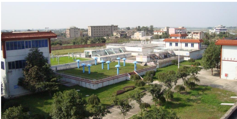
成都沱源自来水公司的自来水处理设施全景