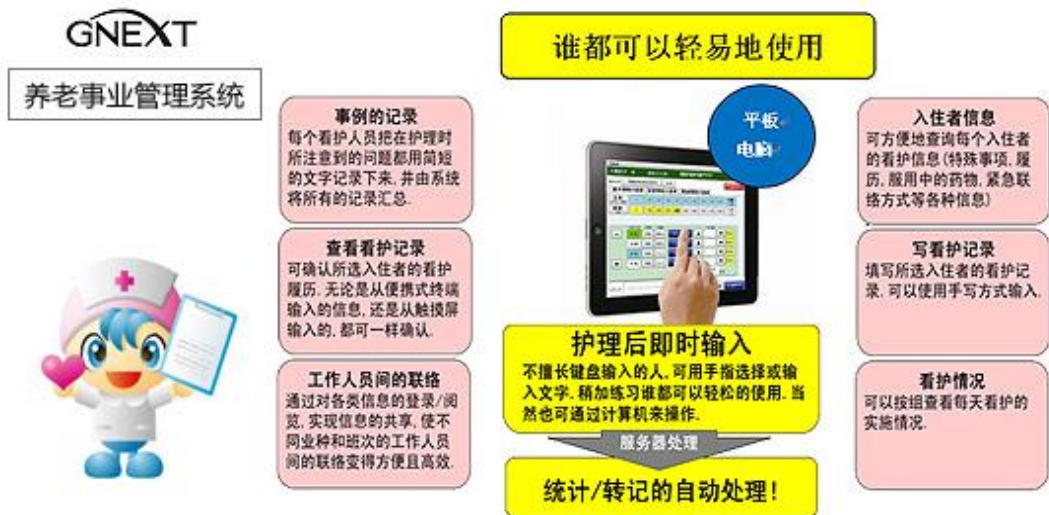
GNEXT养老事业管理系统 概要图

日立系统在日本养老福利行业中拥有首屈一指的销售业绩和业务经验，旗下“福祉之森”系列产品亦经过了10多年的积累和发展，已经非常成熟和完善。“GNEXT养老事业管理系统”是以“福祉之森”系列产品中的“设施护理记录系统”为基础，融合中国本土化需求而量身定制的。通过系统可以记录入住老人的生活、护理人员的日常护理情况，对护理过程进行有效的指导和监管，以此快速提升护理水平，并可以根据需要，对老人的监护人公开整个护理过程，让养老院增加透明度和可信度。