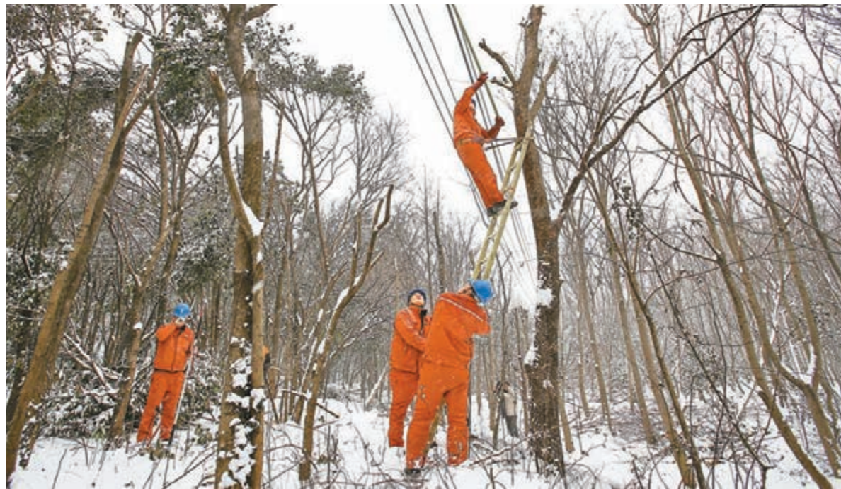
■遼寧、吉林、湖南、江西等省級電網用電負荷均突破歷史極值。圖為工作人員在江蘇南京紫金山排查電線安全隱患。

這次災害性天氣給春運期間的交通運輸「雪上加霜」，各地交通運輸受到不同程度的影響。據交通運輸部最新統計，江蘇、浙江、安徽、江西、湖北、湖南、重慶、四川、貴州等15省份104條高速公路的133個路段封閉；濟南、西安、上海和武漢鐵路局共停運200列高鐵客車；合肥、南京、杭州、長沙、貴陽等10個機場已取消866個航班。在湖南的鳳凰縣沱江鎮、吉信鎮等地，高速公路出口3天累計滯留遊客4,000多人。