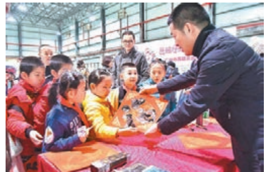
■外來工家庭的青少年收到春「福」。

香港文匯報訊(記者 敖敬輝 廣州報道)昨日，廣州迎來入冬以來最寒天氣，由廣州團市委、市青聯主辦的「花城有愛·冬日暖陽」系列公益行動之「愛心劇場」活動在廣州青年文化宮舉行，80多位困難家庭青少年、清潔工子女、外來務工青年、特殊青少年免費觀看一場電影，並開展玩遊戲、送福字等活動。在農曆新年即將到來之際，特殊群體青少年收到了提前送出的新年禮物和祝福。