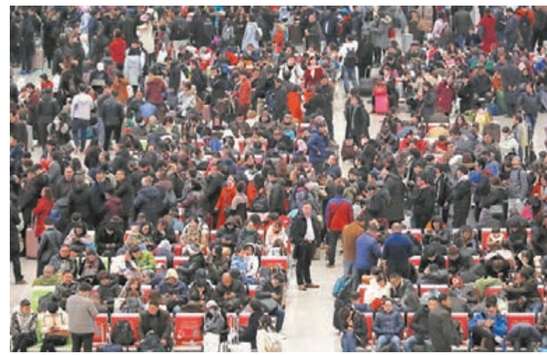
■上周六，受雪雨天氣影響，上海虹橋火車站出現旅客滯留。

此外，包括北京西站始發G557、G517、G659、G509次列車；北京站始發K7701/2次列車停運；天津西站始發G8902次列車也相繼停運。上周五，受大雪影響，武漢當地始發的超百趟列車宣佈停運。全國多地鐵路運輸系統都因極端天氣