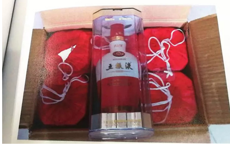
假冒五粮液。

一瓶高仿的 15 年贵州茅台酒，进价 1300 元，转手卖到 6300 多元，纯利润高翻了近 4 倍……在暴力驱使下，江苏苏州的徐某夫妇用低档酒，冒充茅台、五粮液、洋河、剑南春等名酒对外销售，最终被公安机关查获。