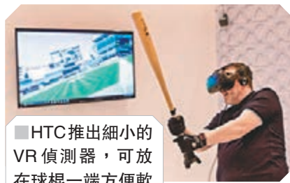
■HTC推出細小的VR偵測器，可放在球棍一端方便軟件開發。

事實上，在場館內較引起人注意的反而是VR開發工具，像HTC的Vive Tracker便集合了細小但強大的優點，這款動作追蹤器連100克都不到，可安裝