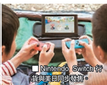
■Nintendo Switch行貨與美日同步發售。

早前任天堂舉行全球直播發表會，宣佈其新家用主機Nintendo Switch(NS)落實於3月3日面世，更重要是香港會有同步行貨，售價為2,340港元。由上周六起，香港多間遊戲店已提供預訂服務，想快人一步玩到NS的朋友就要盡快訂機了。