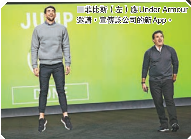
■菲比斯(左)應Under Armour邀請，宣傳該公司的新App。

似乎是自覺在運動用品已屆不敗之地，UA開始要面對蘋果等公司的挑戰。Kevin認為假如蘋果他們想沾手服裝和鞋履市場，那UA就要將之打破，而誰能夠發明次世代T恤即可穩操勝券——所謂次世代T恤，UA表示他們正計劃研發智能襯衫，它透過袖子來偵測穿着者的流汗程度，從而調節衣服中的纖維成分。雖然Kevin坦言這種衣服至少10至20年後才有望實現，但他已着手推出其他能幫助熱愛運動人士的產品。譬如如下月面世的「運動員即可用」裝置，人們只需穿上備有它的鞋子走動三天，那便會偵測出使用者的身體狀