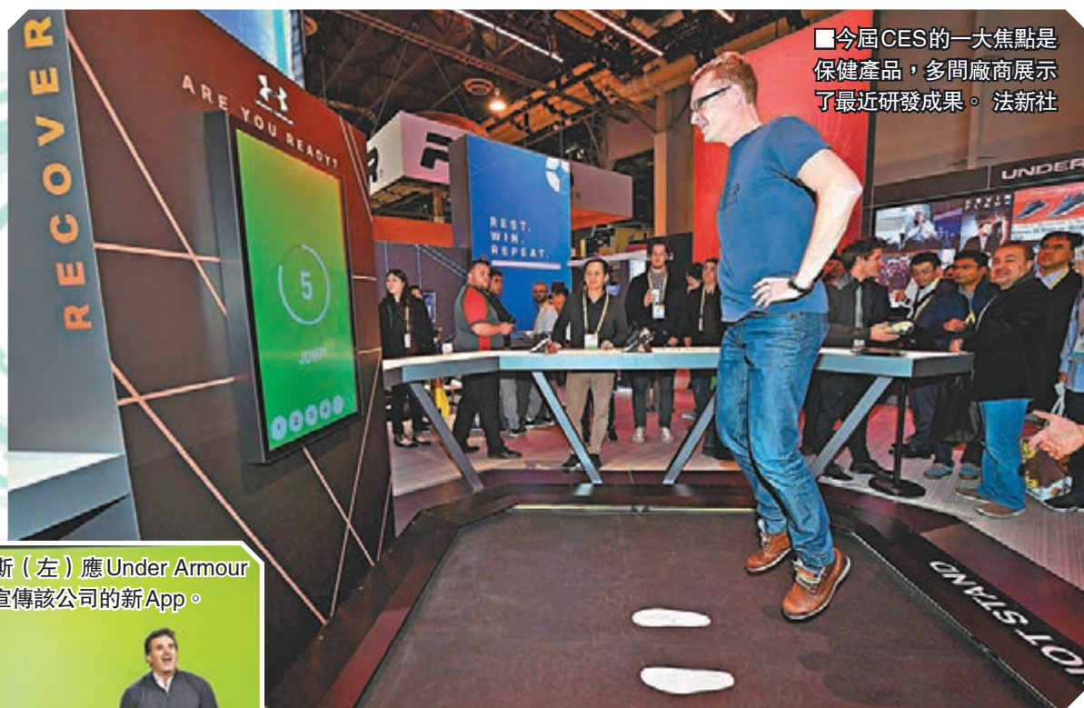
■今屆CES的一大焦點是保健產品，多間廠商展示了最近研發成果。