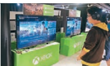
■《Halo Wars 2》雖是實時戰略遊戲，但要靠卡牌決勝負。

由Creative Assembly與343 Industries開發、微軟發行之Xbox One遊戲《Halo Wars 2》，將於下月17日