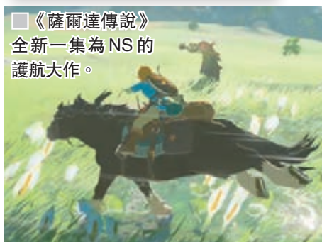
■《薩爾達傳說》全新一集為NS的護航大作。

雖然NS暫未獲很多海外大廠全力支持，但至少2K Games、EA和Ubisoft等都表明會為它開發遊戲，包括《NBA2K18》、《Skyrim》和《Just Dance 2017》等。首發作品方面，任天堂自家會有經典ARPG《薩爾達傳說Breath of the Wild》與適合多人開心暢玩的《1-2-Switch》，Konami也帶來令人驚喜的《炸彈人》新作《Super Bomberman R》，其餘還有Square Enix的《Dragon Quest Heroes 1&2》和《祭物與雪中的剎那》、世嘉的《魔法氣泡俄羅斯方塊S》、日本一的《魔界戰記Disgaea 5》等。至於人氣甚高的《仔寶賽車》跟《Splatoon》新作，則分別會在4月底和今夏發售。