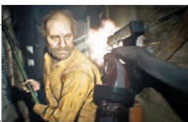
■《Bio7》現已發售，據知行版的過激程度遠超日版。

全球機迷期待已久的生存驚悚超大作《Biohazard 7》，日前經已在本港推出(普通版與特別版)，而PS4