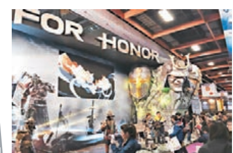
■《榮耀戰魂》是TpGS的一大看點。

於上周四起一連六天，台北國際電玩展(TpGS)假台北世貿中心一館舉行，不只有多款手機及電腦遊戲展出，PlayStation和Ubisoft也設有大型攤位讓機迷試玩未來數月新作。其中Ubi的《榮耀戰魂》(For Honor)是焦點之一，它更會在TpGS結束後展開封閉測試。另外，香港索尼由即日起推出新春優惠，購買PS4主機或指定同捆裝可獲最多388港元之「賀年電子大利是」，包括剛推出不久的薄版PS4白機。