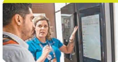
■Samsung的新智能雪櫃能直接落單購物。

除了手機是讓我們無時無刻都可上網的工具外，網絡應用更已伸展至各種家電，而家電往「物聯網」方向發展也是順理成章。韓國兩大生產商Samsung和LG已在雪櫃引入上網元素，其中前者更把操作介面升級至Family Hub 2.0，不單提供食物運送、煮食、定位和家居保安等功能，其操作輸入平板還可作娛樂用途(如看影片和玩遊戲等)，不再只是一個普通的雪櫃。