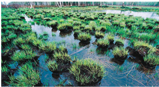
獨特的濕地生態美景

進入「十二·五」，伊春正積極謀劃更多的生態保護和基礎設施建設項目進入國家政策範圍，着力促進伊春生態建設由保護培育向綜合治理、系統化推進轉變。「十二·五」期間，全市林木蓄積量年實現淨增近1000萬立方米以上；到「十二·五」期末，全市森林蓄積量將增加4000多萬立方米以上。