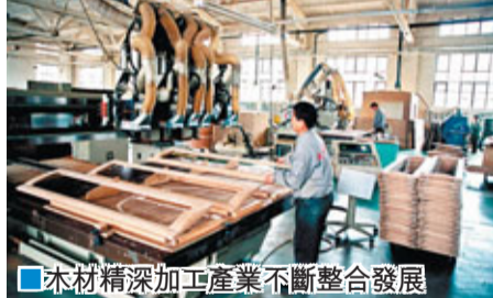
木材精深加工產業不斷整合發展

功實現嫁接，冶金建材礦產開發支撐能力不斷增強。與此同時，伊春堅持借助外力推動經濟轉型，2010年全市招商引資到位資金132.6億元，同比增長134%，華能、中鐵、華儀、華潤、通德集團、永同昌集團等一大批戰略投資者落戶伊春。