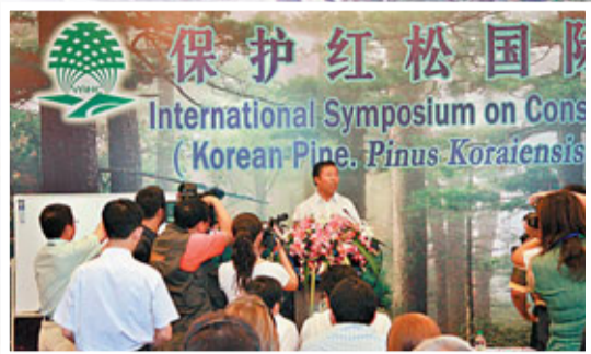
伊春市委書記許兆君在保護紅松國際研討會上演講