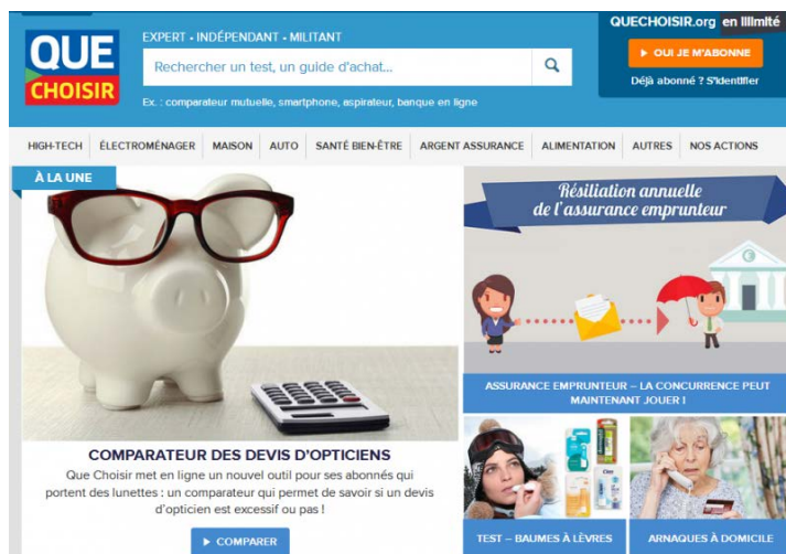
UFC-Que Choisir 网站主页。

法国消费者权益保护团体“消费者优选联盟”（UFC-Que Choisir）近日针对九家食品和化妆品公司向司法机关提出投诉，认为这些公司的产品中包含纳米微粒，但在包装标签上并没有做出说明，涉嫌违法。