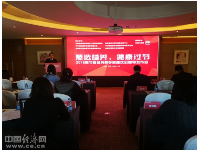
2018春节食品消费专家建议及倡导发布会现场

如何才能避免“每逢佳节胖三斤”？如何在春节期间，每日既能够品尝美食，同时保持健康好身材。1月24日，中国疾病预防控制中心营养与健康所、中华预防医学会健康传播分会、中国营养学会营养与慢病控制分会、科信食品与营养信息交流中心、中华预防医学会健康促进与教育分会和食品与营养科学传播联盟六家机构在北京联合发布《“慧选营养，健康过节”——2018春节食品消费建议》（以下简称：《建议》），根据春节期间国人食品消费大数据，给出精准的节日食品消费建议，倡导膳食多样化、均衡搭配、三餐有度。