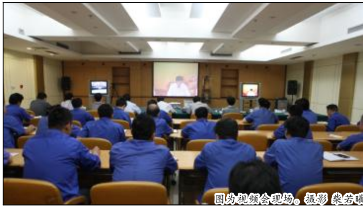
图为视频会议现场。