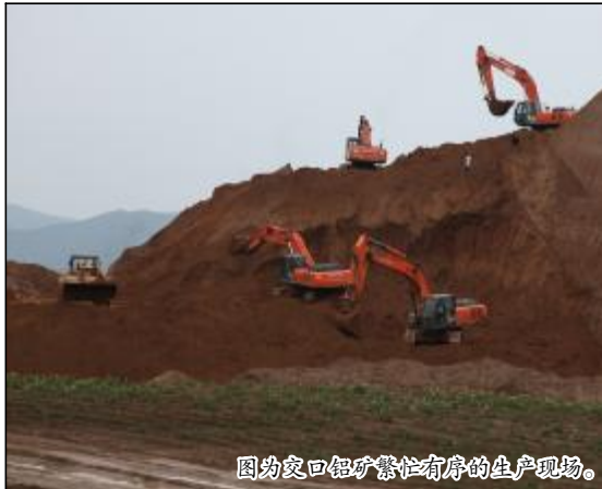
图为交口铝矿繁忙有序的生产现场。

为了更快更好更全面的推进专项工作开展，矿业公司党政联合行文，制定了《运营转型奖励办法》，形成了长效激励机制。对专项工作和“百千活动”月度奖励额度达到5000元以上，课题和改善点都在阶段效果、实际收益等方面受到了不同程度的奖励，极大地调动了广大党员、骨干参与专项工作的积极性。当前，矿业公司内部形成了“课题创标杆，改善点争优秀”的良好态势。以“党组织抓项目持续改进，党员抓改善消除浪费”为载体的专项工作开展过程中，党总支抓项目、党支部抓课题、党员抓改善点，强化运营转型理念，丰富了矿业公司党总支诊断问题、分析原因、制定改善措施的方法和手段，提升了党建工作实效，特别是增强了一线党员和员工主动思考、提出、分析和解决问题的意识和能力，培养了爱岗敬业、降本增效的自觉性，使专项工作在提升党建管理水平，助降本增效的实际效果上呈现出星火燎原之势。