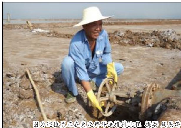
图为巡检员正在更改拜耳法排料流程

接下来就是对坝体的巡检了。坝体高约 40 米，相当于 10 楼那么高，顺着人工开凿（下转第二版）