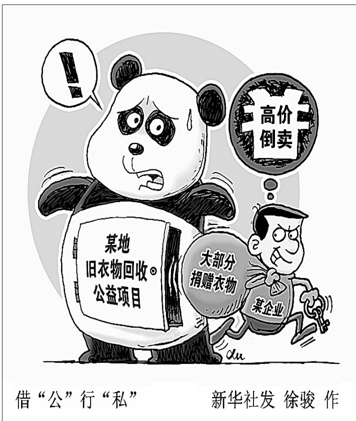
借“公”行“私”