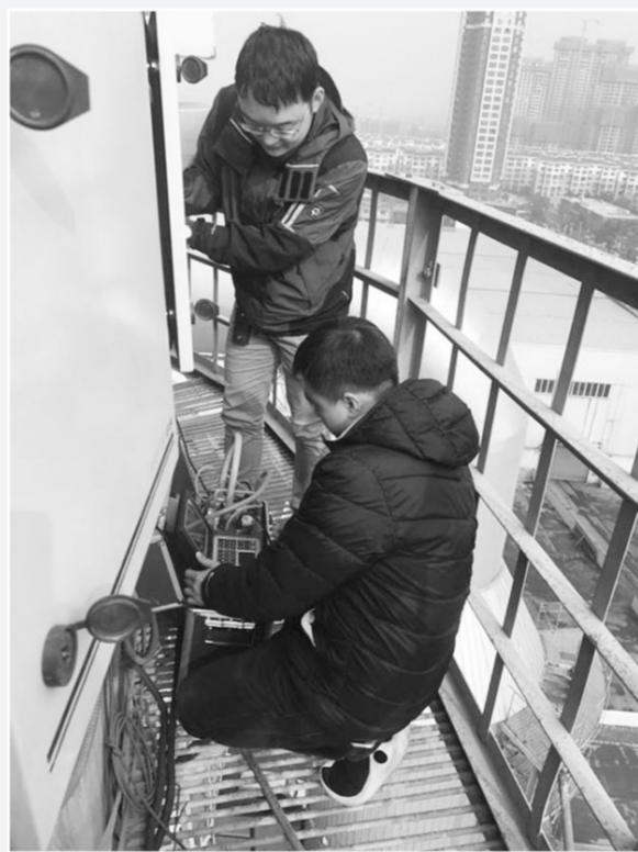
西安市环境监测人员爬上供热企业烟囱,对主要污染物的排放情况进行实地监测。

和监管力度,落实乡镇、村委和园区的主体责任。要突出重点,加快生态化改造、病死猪无害化处理、养殖小区建设等工作进度,相关职能部门要划片负责,派专人给予技术指导,加强监管和验收,确保“保家行动”各项目标任务圆满完成。 据悉,新余市自3月集中开展畜禽养殖、水库退养、工业污染3个专项整治的“保家行动”以来,全市禁养区关停、拆除或改造养殖场6295家,完成总任务的99.2%;可(限)养区关停、拆除或改造养殖场694家,完成总任务的75%;333座水库、2293座山塘全部退出承包养殖。 黎燕平